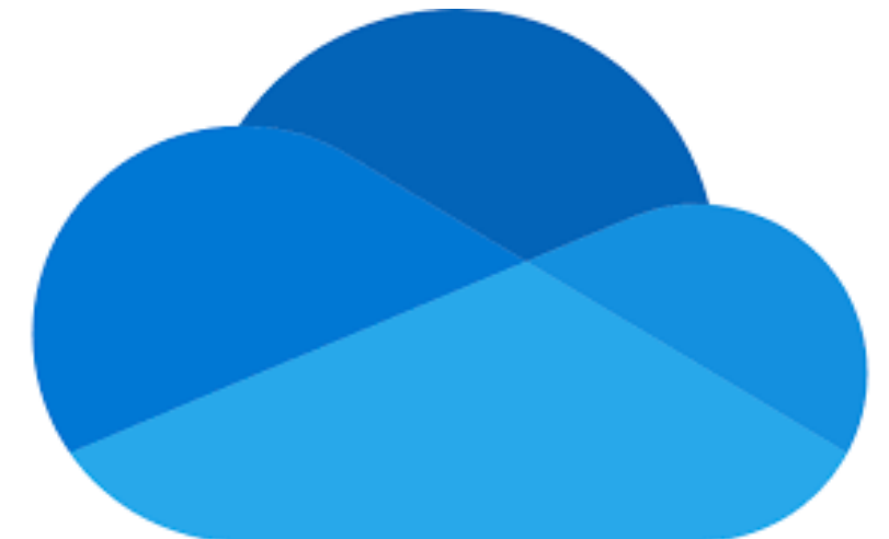
Onedrive (espai al núvol)