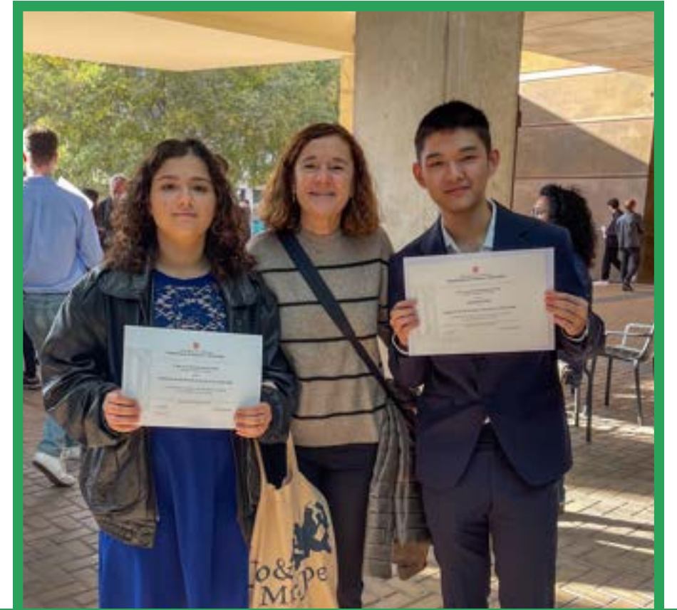
Preparació a les PAU