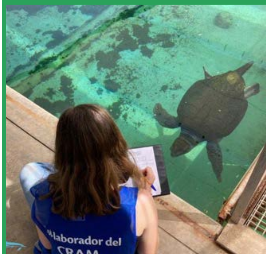
Treball de Recerca